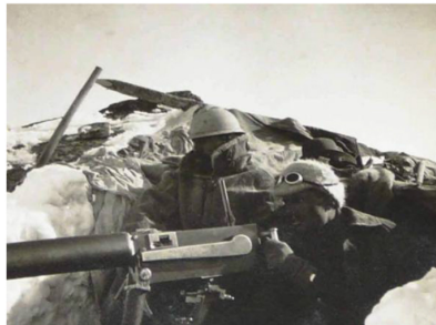
Un'immagine scattata durante la prima guerra mondiale