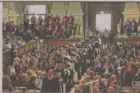
Una cerimonia con i rettori nell'aula magna di Santa Lucia